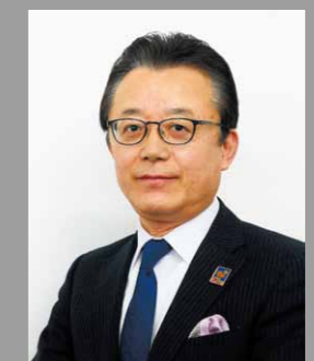
大家近江陶業株式会社 总经理

大家近江陶業株式会社以大家集团的企业宗旨“Otsuka - people creating new products for better health worldwide”为公司理念，从1973年开始制造“陶板 (toban)”，成功地开发了当时世界上最早的超薄而且坚固难以弯曲的“大家大型陶板 900×3000×20mm”。我们通过 OT 陶瓷和红陶的制造，追求“陶板 (toban)”的可能性，相继确立了广泛的表现手法，极高的再现精度与值得信赖的加工手法。这些成绩是来源于负责设计和建筑的工程师，艺术家，作家以及热爱陶板 (toban) 的各位的无限支持，我们在此深表谢意。我们追求和完善「日新月异的陶板 (toban) 技术」，坚持创造能满足现代社会需求的富有创意的事物。制作丰富的生活空间，继承宝贵文化遗产等继续利用「陶板 (toban)」的特性，追求大家近江陶業才能实现的有存在感的制造业。请各位继续给与热心的支持和关心。