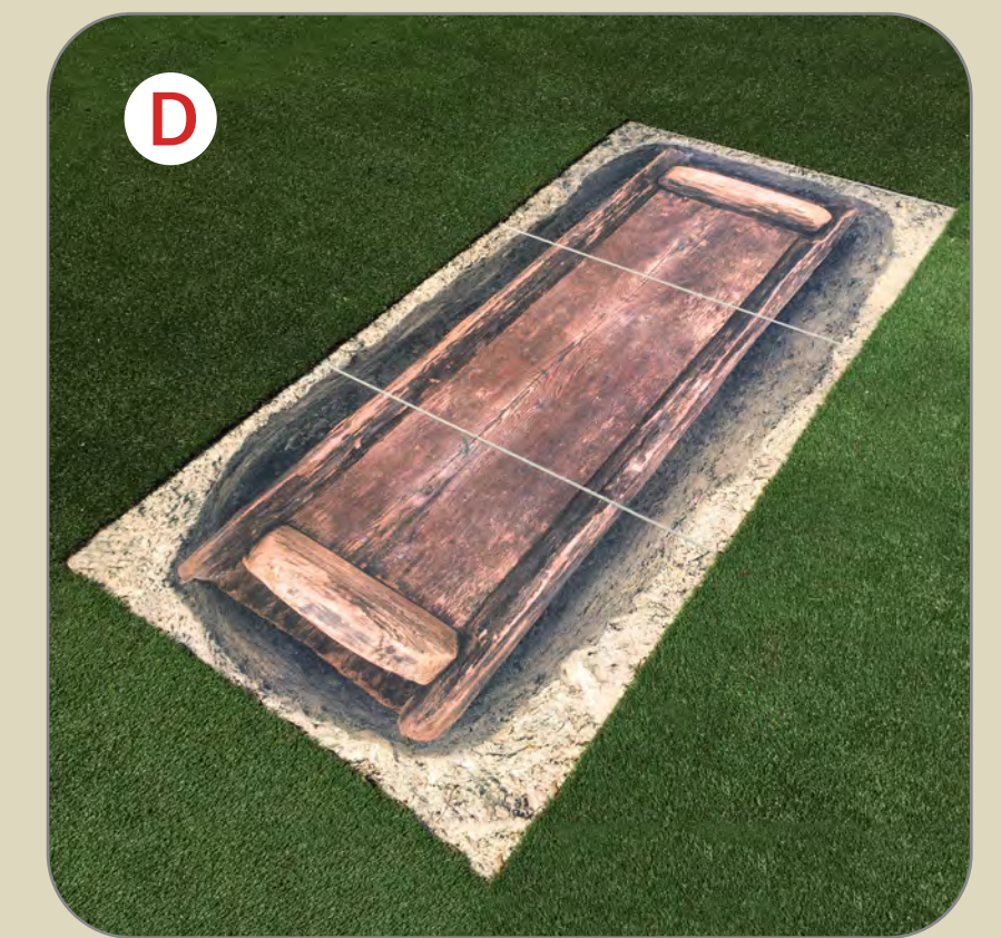
H1200×W2400×T20mm / 3枚組