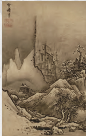
1989 国宝《秋冬山水図 (冬景)》 雪舟等楊筆 室町時代 15世紀末~16世紀初