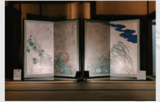
酒井抱一《夏秋草図屏風》