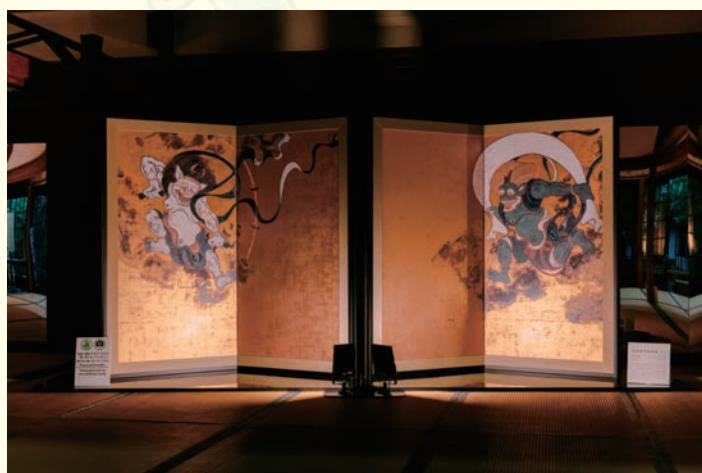
俵屋宗達 《風神雷神図屏風》