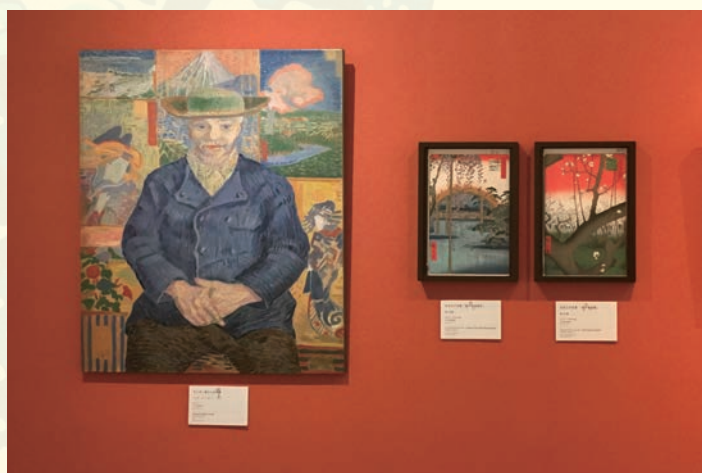
ゴッホ、フィンセント・ファン 《タンギー爺さん》 歌川広重 名所江戸百景《亀戸天神境内》／名所江戸百景《亀戸梅屋敷》