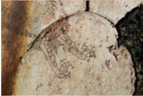
白虎（部分） White Tiger (detail)