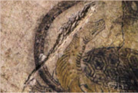
玄武（部分） Black Tortoise (detail)