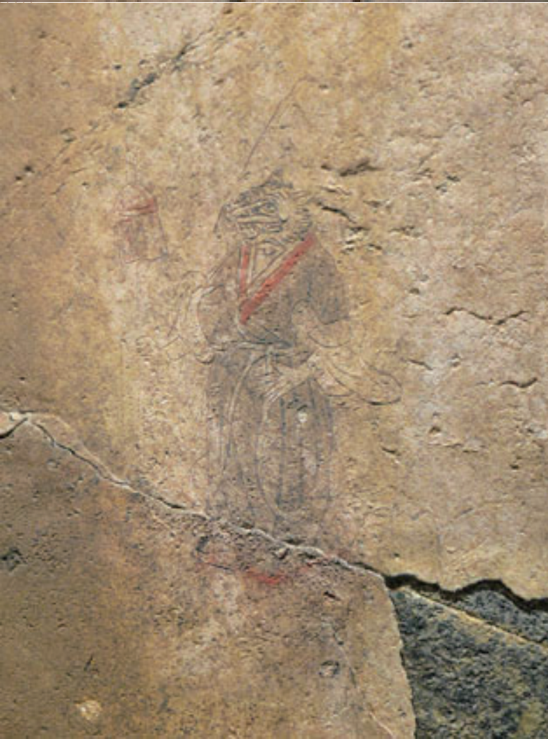
下絵の刻線 詳細：(寅部) Engraved lines of sketch drawings under mural painting Detail: Tiger