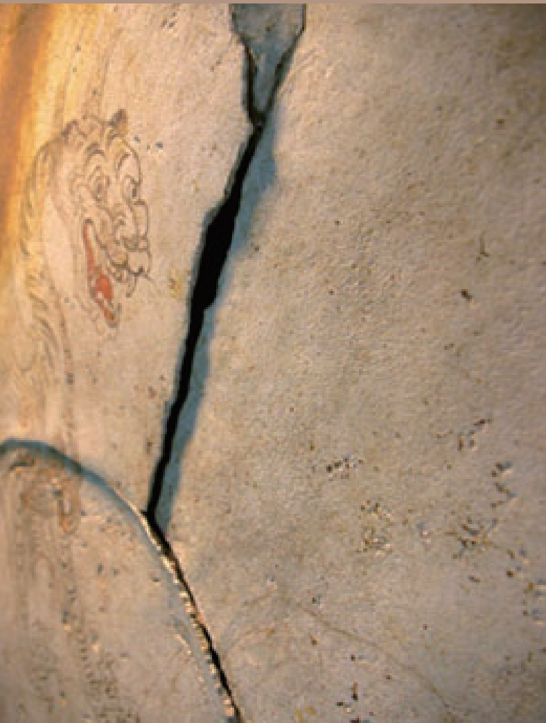
浮き上がった漆喰の様子 View of the raised plaster