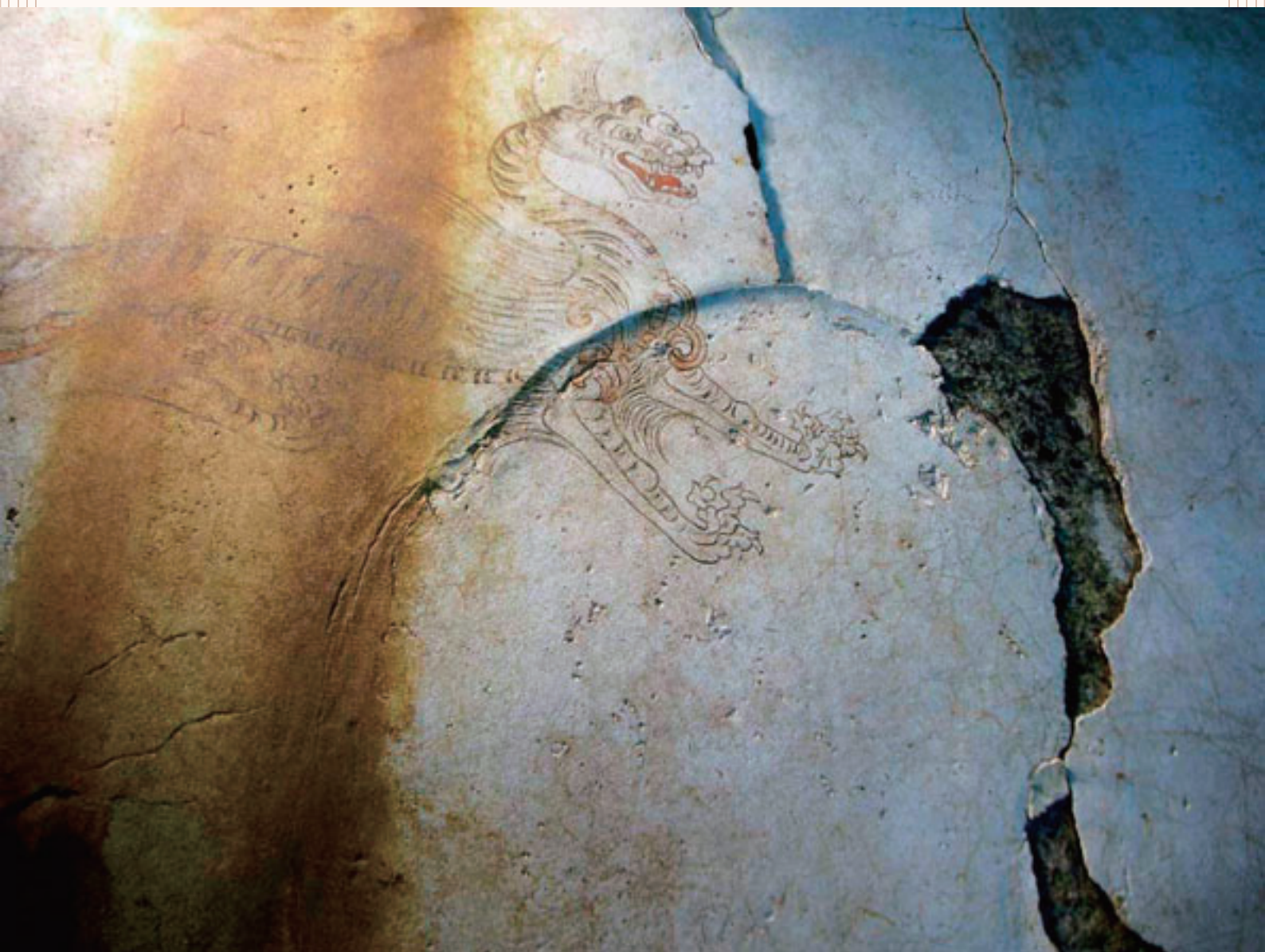
完成した陶板 Finished ceramic board reproduction

We succeeded in reproducing even subtle differences in wall textures, such as mud covered surface and traces of rainwater.