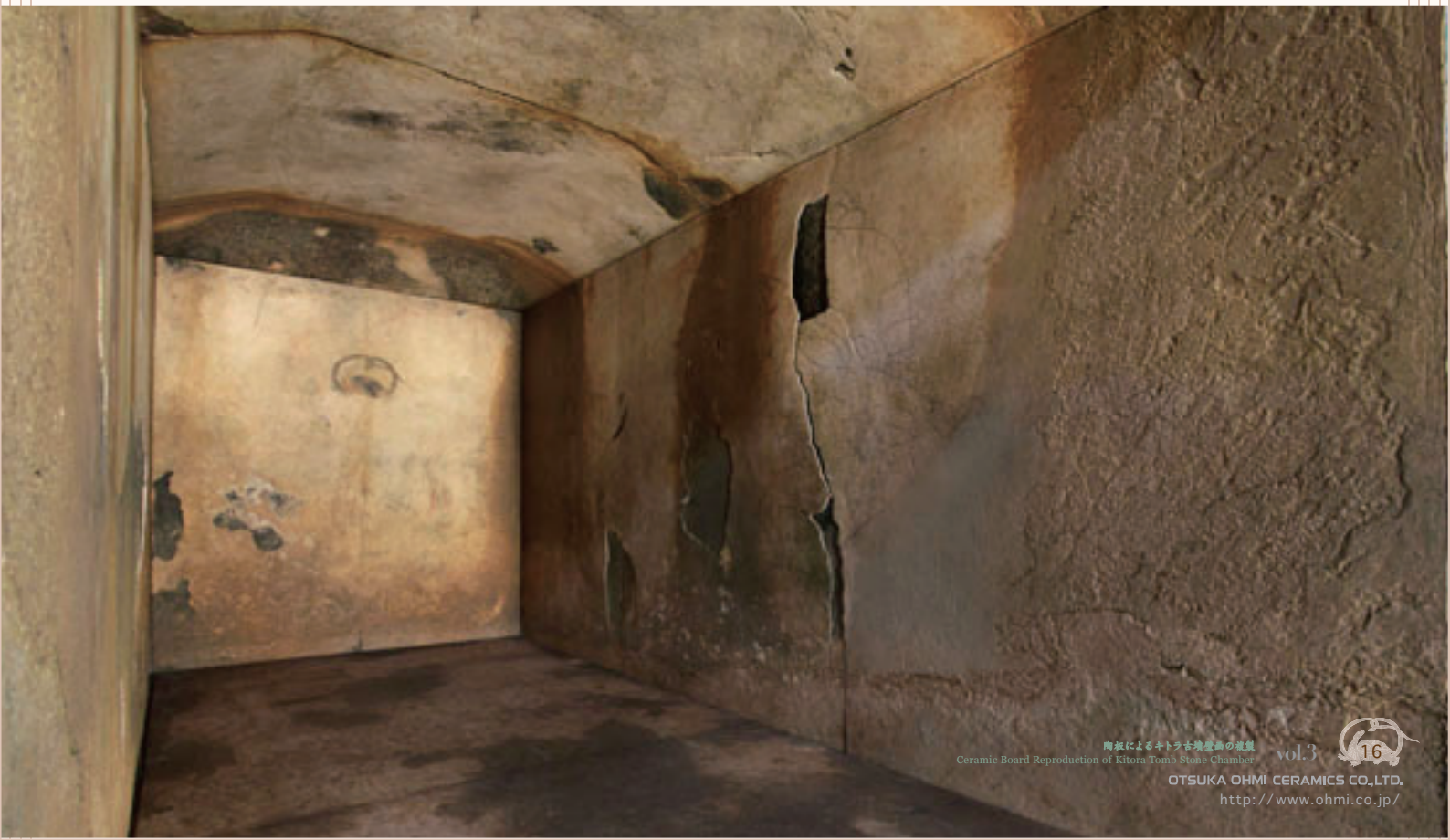
複製された石室内の様子 Inside view of the reproduced stone chamber

We are hoping that our ceramic board reproduction to be a part of cultural assets preservation and a means to provide a wide opportunity for people to experience first-hand and appreciate our cultural assets.