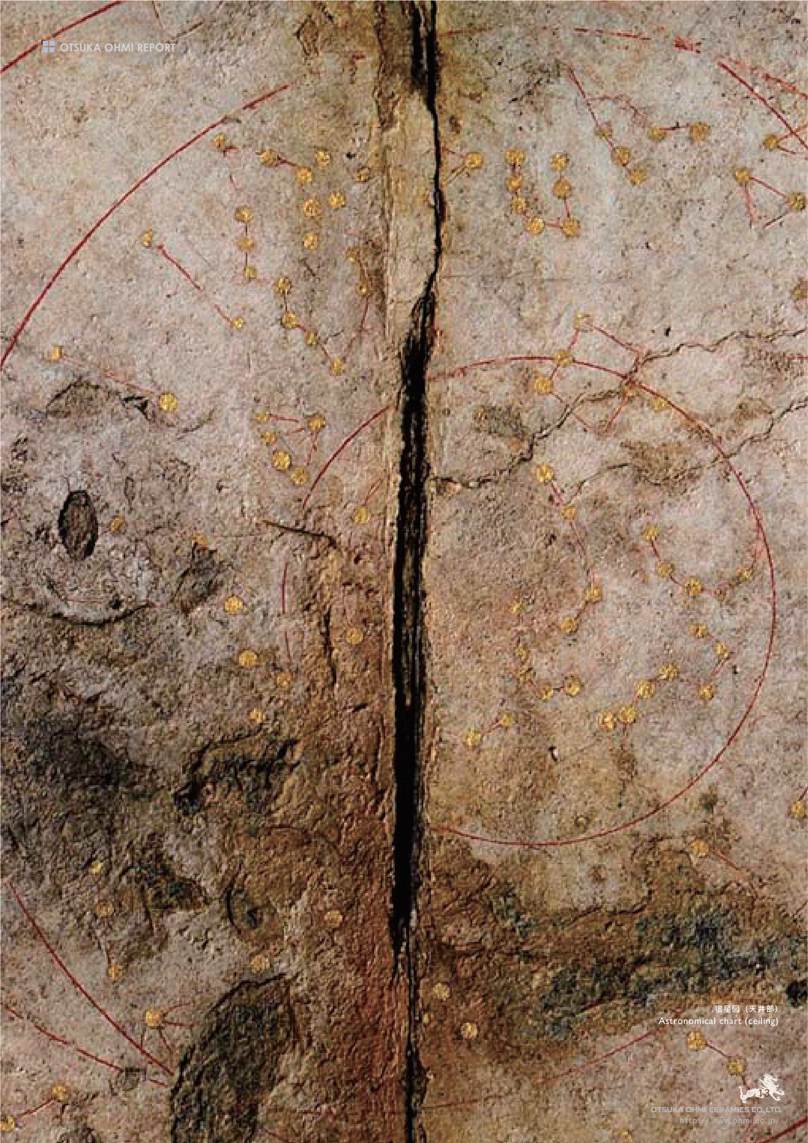
宿星図 (天井部) Astronomical chart (ceiling)