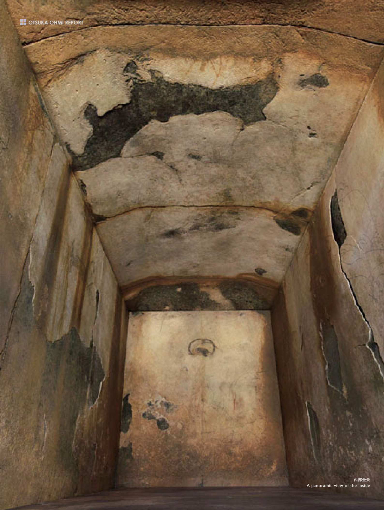
内部全景 A panoramic view of the inside